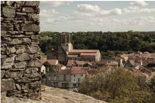
Vouvant depuis la tour Mélusine